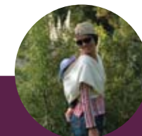
sur le dos